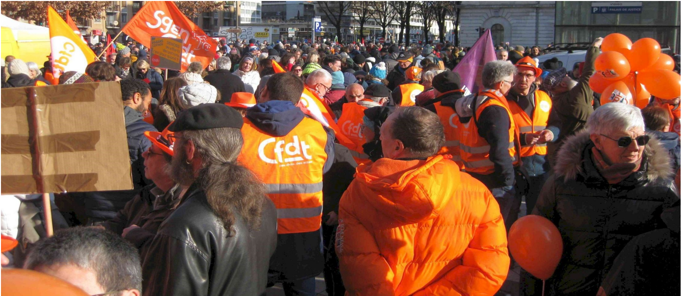
Chambéry le 19 janvier 2023 : La « zone » CFDT lors de la 1 ère manifestation

Depuis le 19 janvier, date de la première manifestation intersyndicale contre l'allongement de l'âge de départ à la retraite, des retraités adhérents CFDT des ULR de la Savoie ont participé à toutes les manifestations qui se sont déroulées à S t Jean de Maurienne, Albertville et Chambéry.