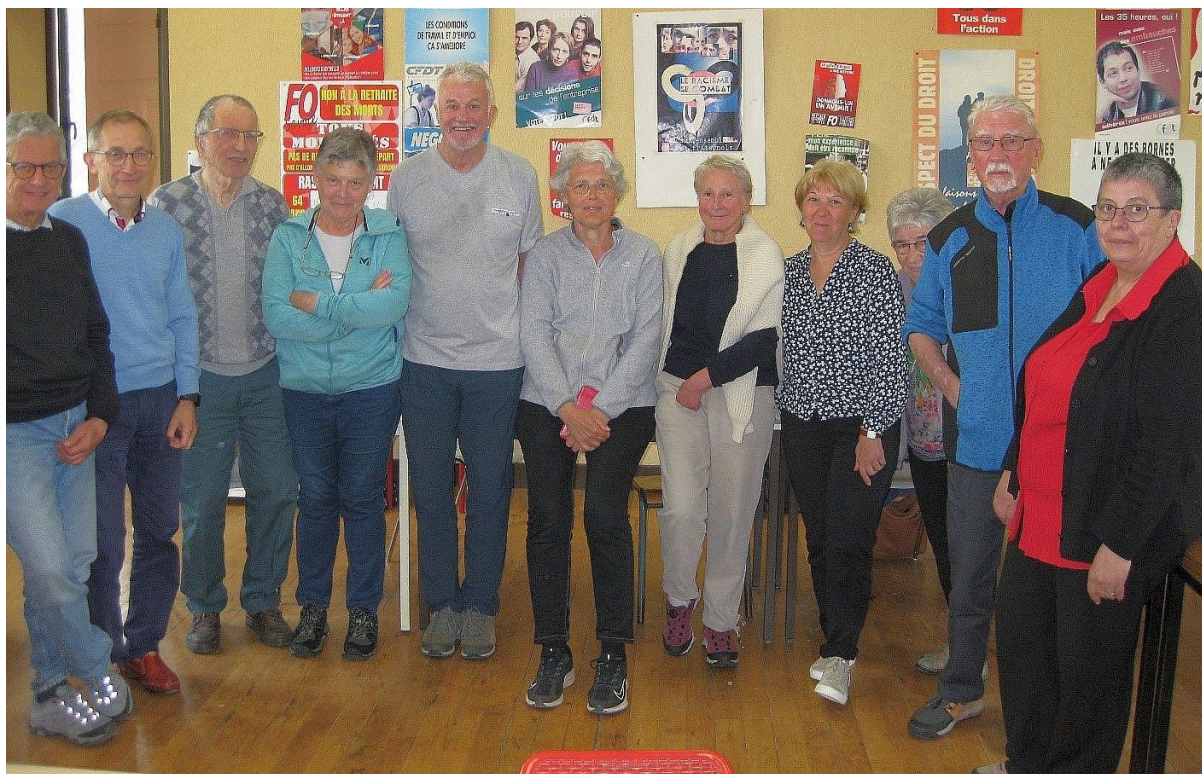
Les présents à la rencontre du 25 mai 2023 à MONTMELIAN