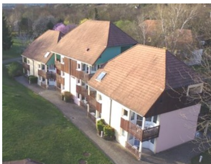
Vue du VVF à Obernai

Vendredi 20 octobre : petit déjeuner, départ 9 heures, découverte de Strasbourg en autocar le matin, déjeuner dans une winstub (bistro alsacien) puis tour de ville sur les canaux de l'Ill, retour au VVF repas et coucher sur place.